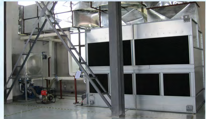
中国电子南京三乐电子信息产业集团公司-多晶炉冷却二期