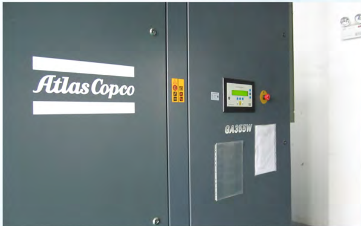
瑞声光电科技（常州）有限公司-阿特拉斯空压机房3