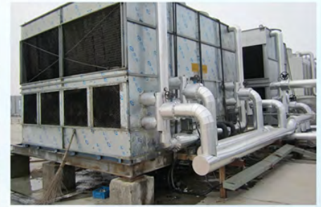
瑞声光电瑞声光电科技（常州）有限公司现场2