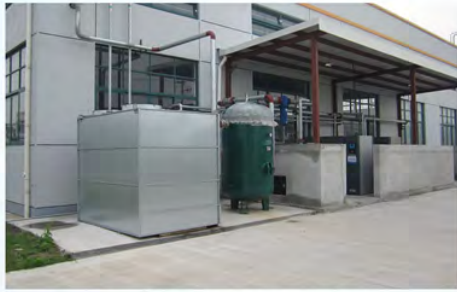
上海人本集团-阿特拉斯空压机冷却