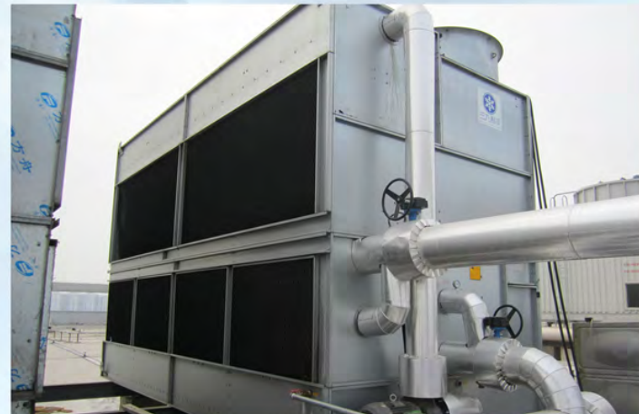
瑞声光电科技（常州）有限公司-阿特拉斯空压机冷却