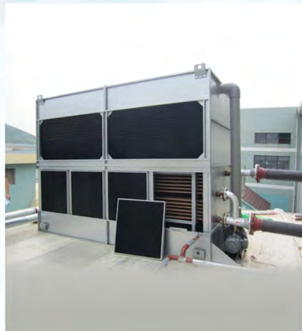
浙江上峰包装-海德堡印刷机冷却