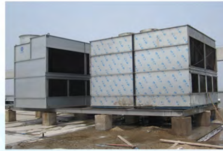
瑞声光电科技（常州）有限公司现场1