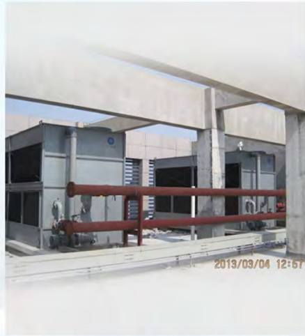
金湖人民医院-清华同方地源热泵冷却