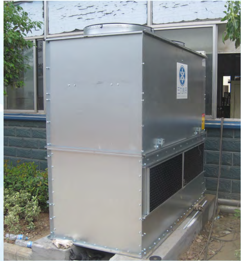
襄阳博亚精工装备股份有限公司-淬火液冷却