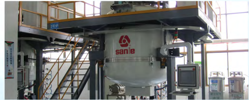
中国电子南京三乐电子信息产业集团公司-多晶炉