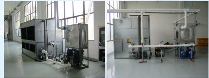
中国电子南京三乐电子信息产业集团公司-多晶炉冷却一期 中国电子南京三乐电子信息产业集团公司-多晶炉冷却三期