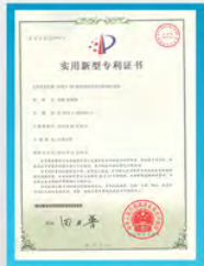
应用于R2C机组的闭式冷却塔制冷系统