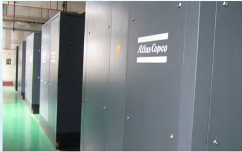
瑞声光电科技（常州）有限公司 阿特拉斯空压机房1