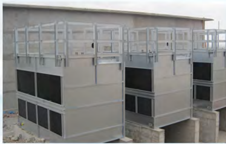
新疆神火集团-锡压空压机冷却2