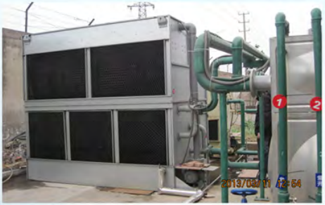
常州东风农机集团有限公司-阿特拉斯空压机冷却