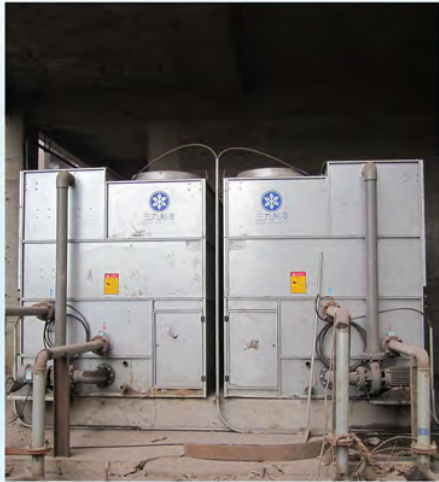
河北钢铁集团迁安联钢鑫达钢铁-变频器冷却