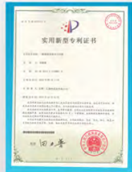
喷淋喷嘴水口挡板专利证书