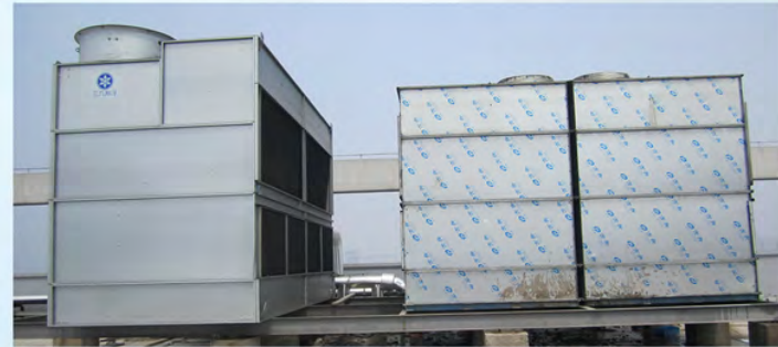
瑞声光电科技（常州）有限公司现场3