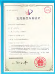
闭式冷却塔及蒸发器专利证书