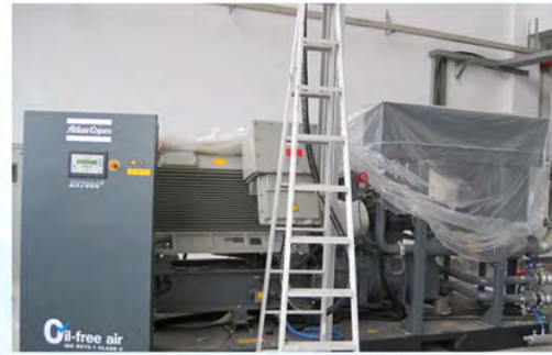
常州旷达集团-阿特拉斯空压机