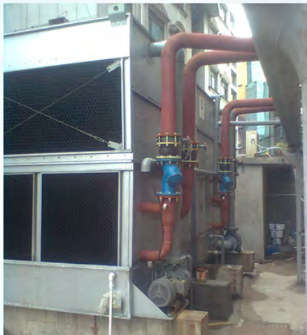
苏州协和大厦-水环热泵冷却