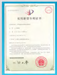
闭式冷却塔填料支撑装置专利证书