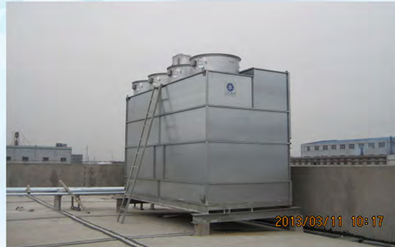
常州旷达集团-阿特拉斯空压机冷却2