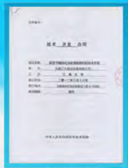
委托技术开发合同