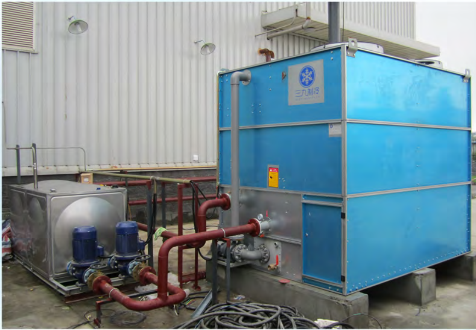
成都铁姆肯轴承-真空炉冷却