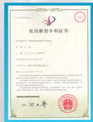
冷却器包管水中分水档片专利证书