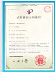
无霜座冷却塔专利证书