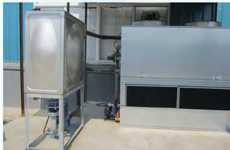
襄阳博亚精工装备股份有限公司-淬火液冷却