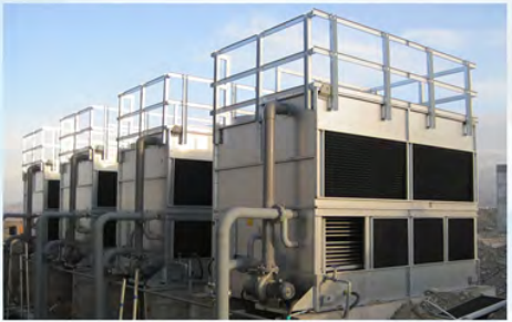
新疆神火集团-锡压空压机冷却1