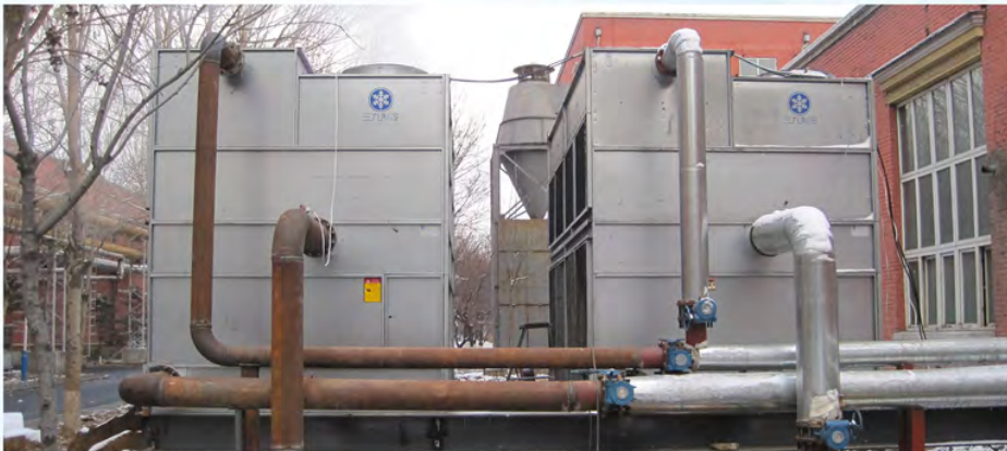
中国一汽集团-寿力空压机冷却