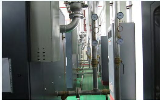
瑞声光电科技（常州）有限公司 阿特拉斯空压机房2