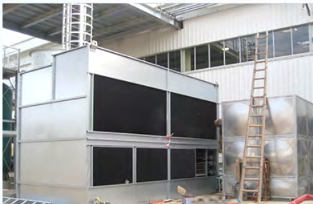
广州日产汽车-淬火液冷却