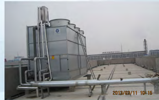
常州旷达集团-阿特拉斯空压机冷却1